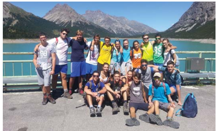
Le vacanze degli adolescenti del San Rocco

V acanze comunitarie 2015, ormai un capitolo chiuso: resta il ricordo delle esperienze vissute, delle amicizie intrecciate e le immagini di volti e paesaggi impressi nella memoria. Per questo, oltre alle foto, lasciamo ai commenti di coloro che le hanno vissute di esprimere emozioni e commenti.