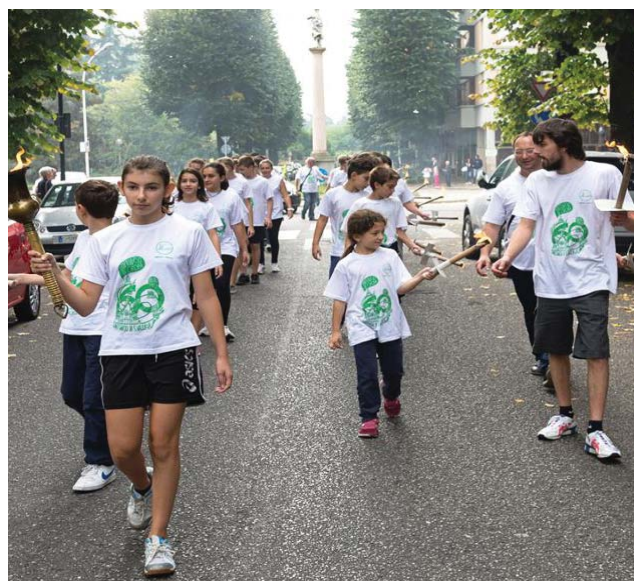
La fiaccolata dello scorso anno

Santuario della Madonna del Frassino, una fiaccolata con tappa a Caravaggio