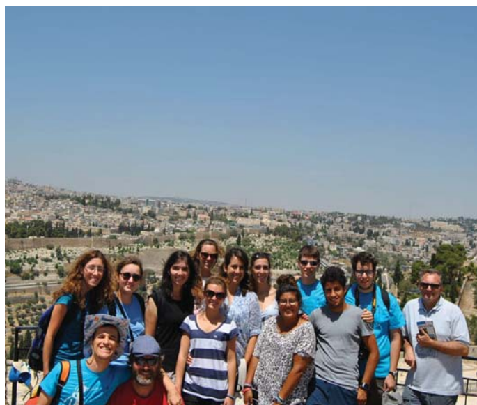
Il gruppo del S. Rocco a Gerusalemme

Una delle cose più affascinanti di un viaggio come questo è riascoltare, come fosse la prima volta, la Parola