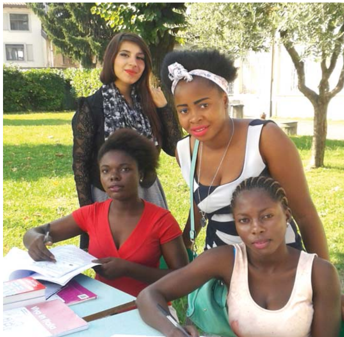
Quattro ragazze durante una lezione 'estiva'