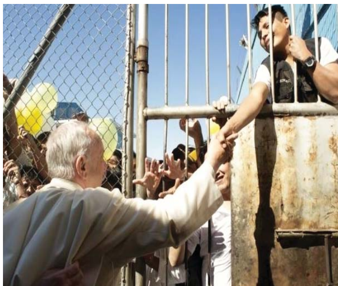
Papa Francesco nel carcere di Palmasola

L'eredità più tangibile della visita è un volume, che proprio Pozzi ha curato e che raccoglie le lettere al Pontefice di chi è in recluso in