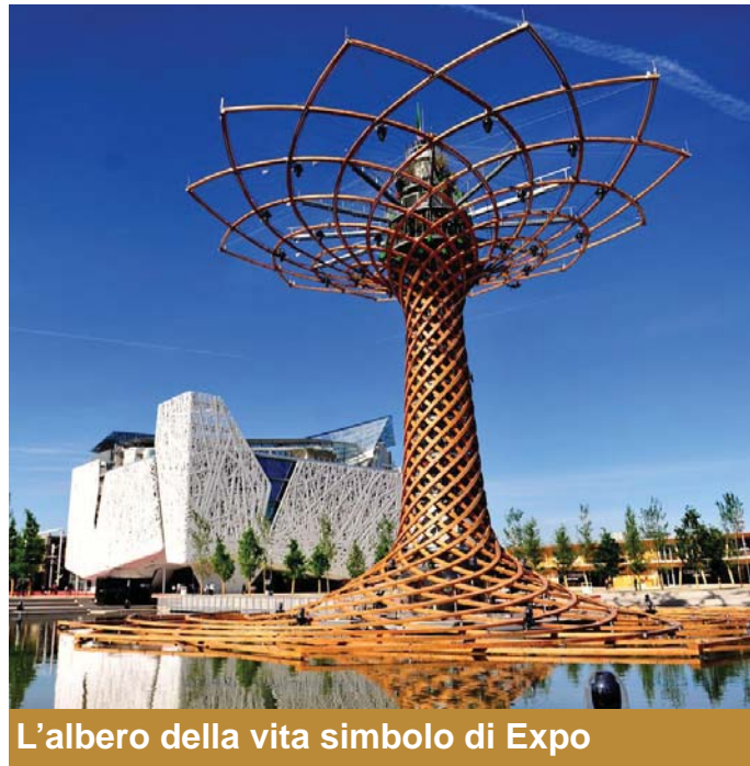
L'albero della vita simbolo di Expo

L'intenzione è di coinvolgere principalmente le famiglie, ma anche i gruppi che in oratorio estivo hanno frequentato i corsi di cucina, in modo che ognuno cucini un piatto, possibilmente legato a vecchi ricordi della festa del Lazzaretto, ma anche, specialmente per chi proviene da realtà esterne, una pietanza legata alle proprie tradizioni, a ricordi di giorni di festa, alla propria storia, o alla propria consuetudine familiare. Oppure quel piatto che "solo la nonna, (o la mamma), sa farlo così buono..."; quello che "con questo ci faccio un figurone", o l'altro