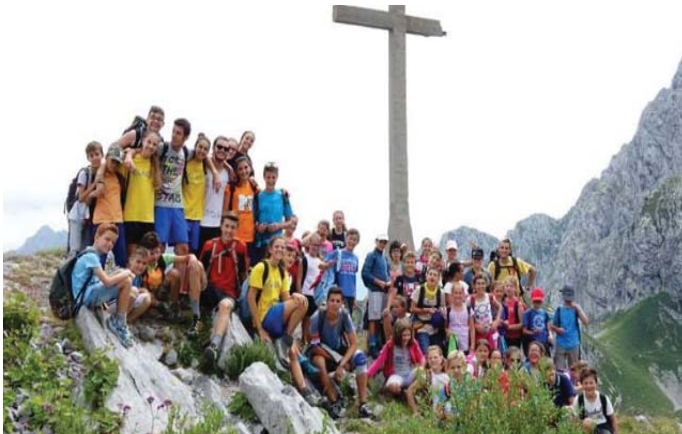
Le vacanze del primo turno del San Rocco