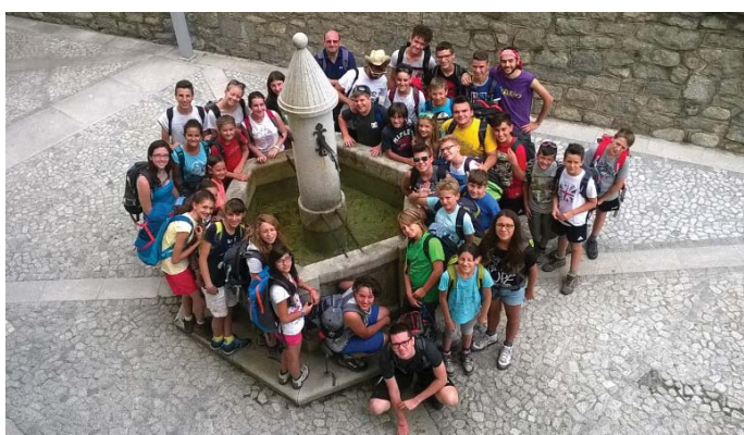
Le vacanze dei ragazzi del Ceredo