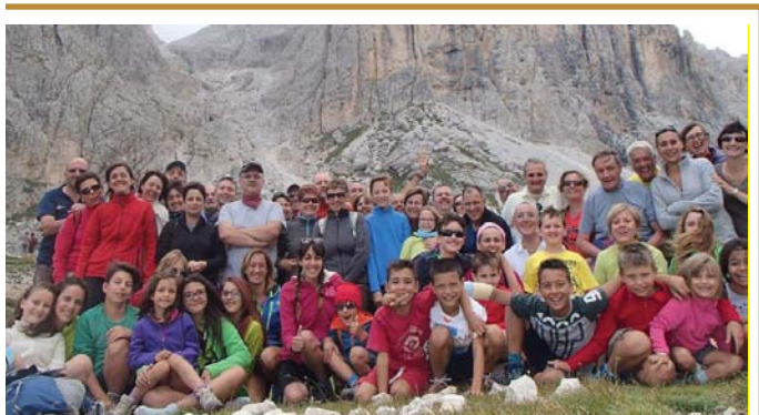
Il gruppo famiglie del Ceredo