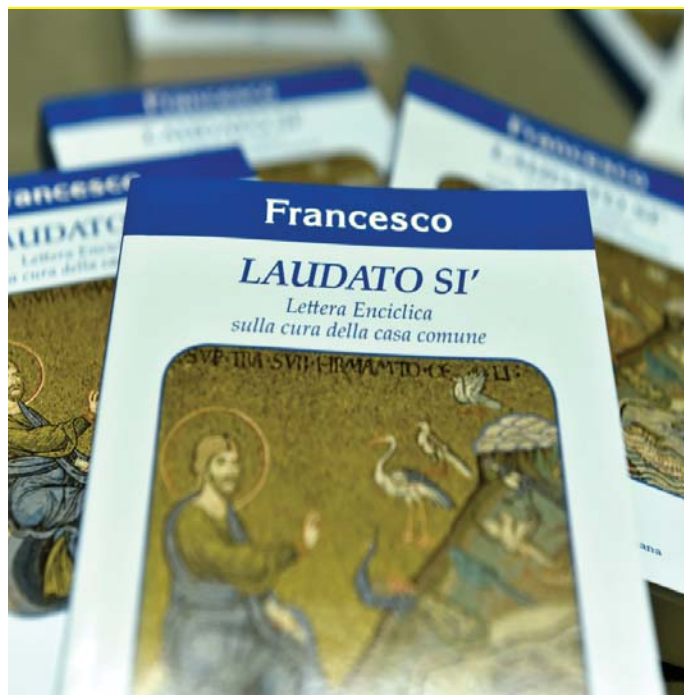
La copertina dell'enciclica del Papa

Quando, oltre un anno fa, ebbi notizia dell'enciclica "ambientale" in preparazione, non potei fare a meno di dire: "Finalmente!". Troppo flebili mi erano sempre sembrate le prese di posizione della Chiesa in campo ambientale. C'erano stati, sì, documenti delle singole Conferenze episcopali (richiamate spesso nell'enciclica), ma chi mai se le era andate a leggere? Ben altro peso e impatto ha un'enciclica. Che si inserisce nel solco della "Pacem in terris", della "Populorum Progressio", della "Evangelii Gaudium".