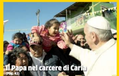
Il Papa nel carcere di Carli (Pag. 43)