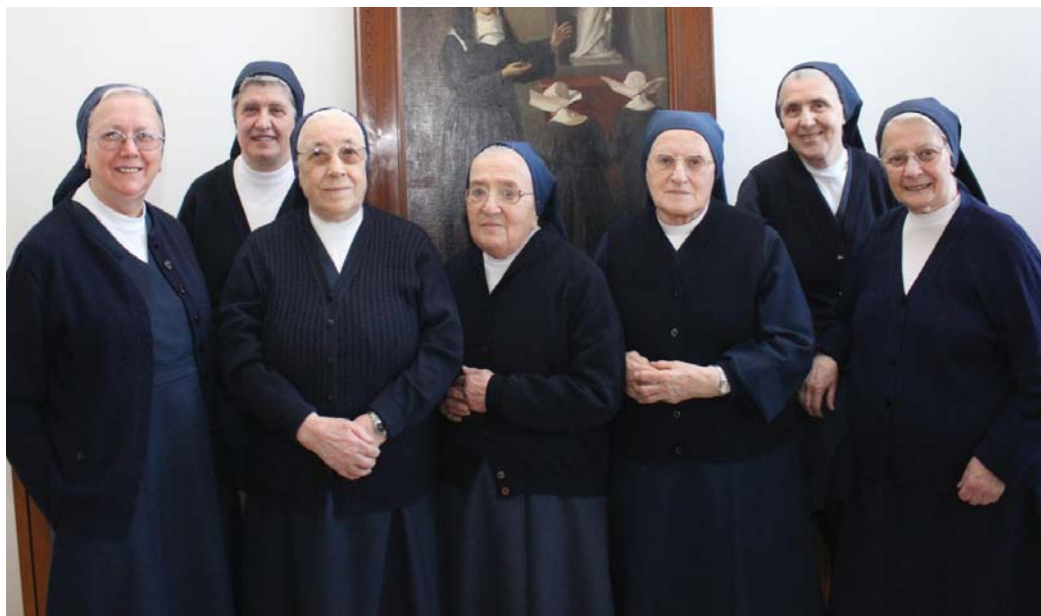
La comunità delle Figlie della Carità di San Vincenzo dell'Istituto Pozzi