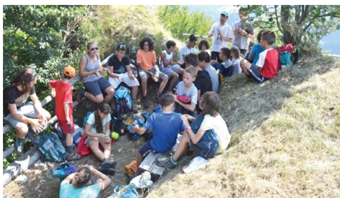
Le vacanze dei ragazzi di S. Ambrogio