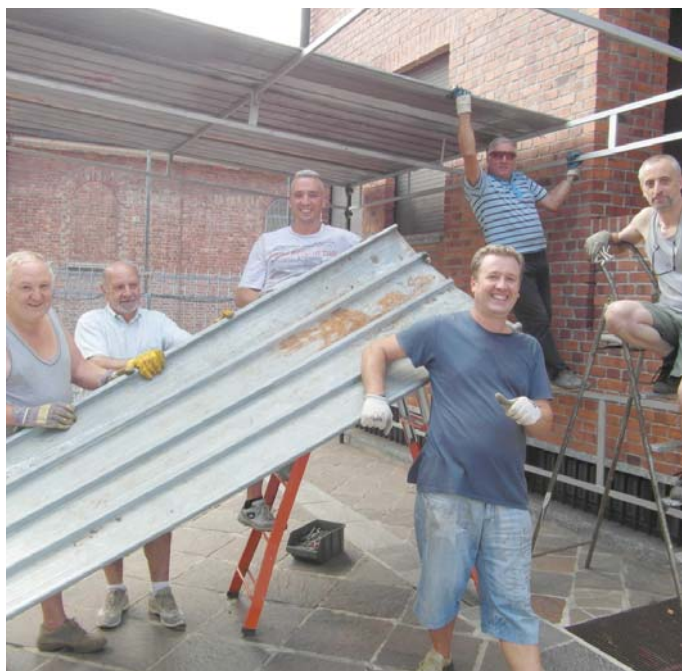
Volontari al lavoro per preparare la festa

Quest'anno poi ha la particolarità di essere il venticinquesimo dalla fondazione del gruppo sportivo ed infatti la serata di giovedì sarà dedicata a loro, i fondatori e chi ha raccolto il testimone negli anni, che ripercorreranno con video, testimonianze, fotografie, un quarto di secolo di impegno, vittorie, sconfitte, gioie, dolori, problemi e soddisfazioni (tanti e tante), sempre al servizio della crescita sportiva ed umana di piccoli e grandi atleti e sempre al fianco dell'oratorio ed in sintonia con esso. Parole e musica perché ci saranno anche i ragazzi