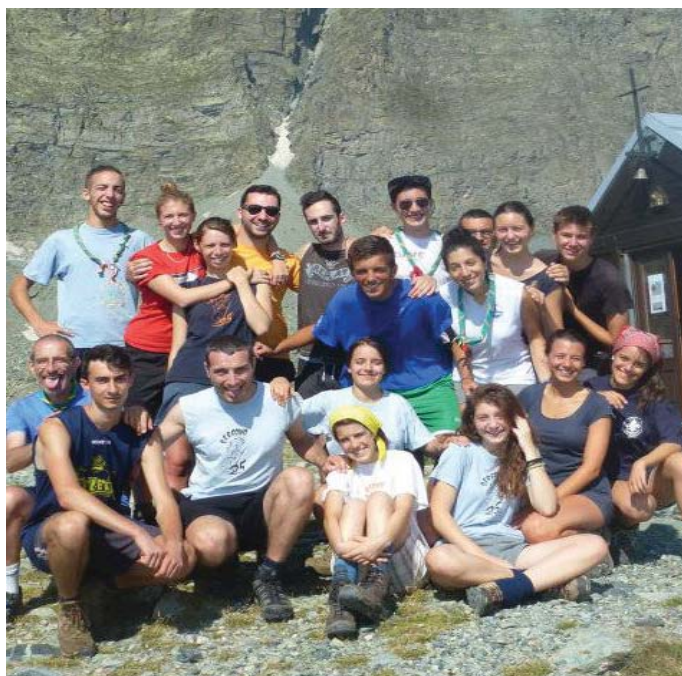
I partecipanti al campo attorno al Monviso

I ragazzi del Noviziato e del Clan Arkadia (tra i 17 e i 21 anni) hanno voluto puntare in alto con un campo mobile at-