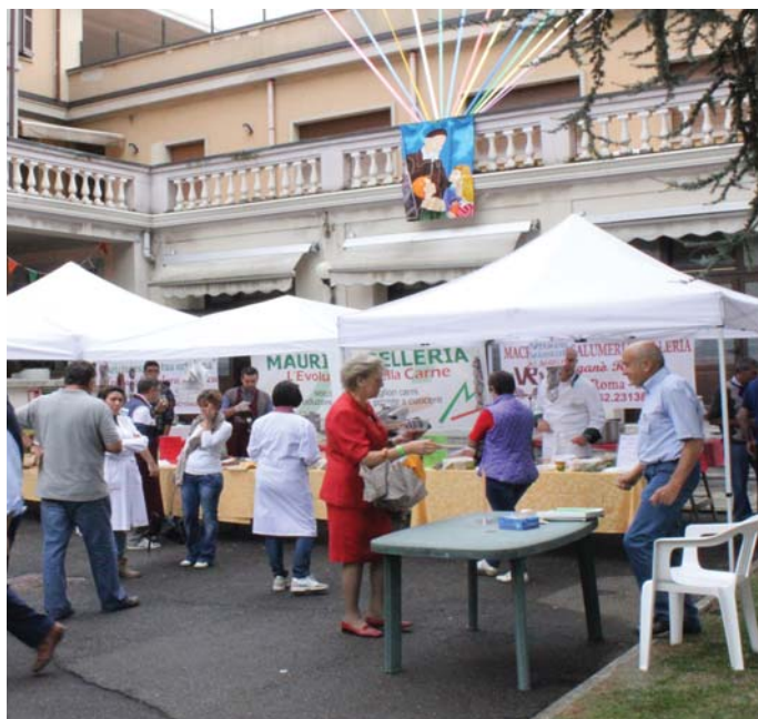
La festa di San Vincenzo anima l'istituto

Nel vostro apostolato talvolta vi trovate di fronte a situazioni familiari o sociali drammatiche: