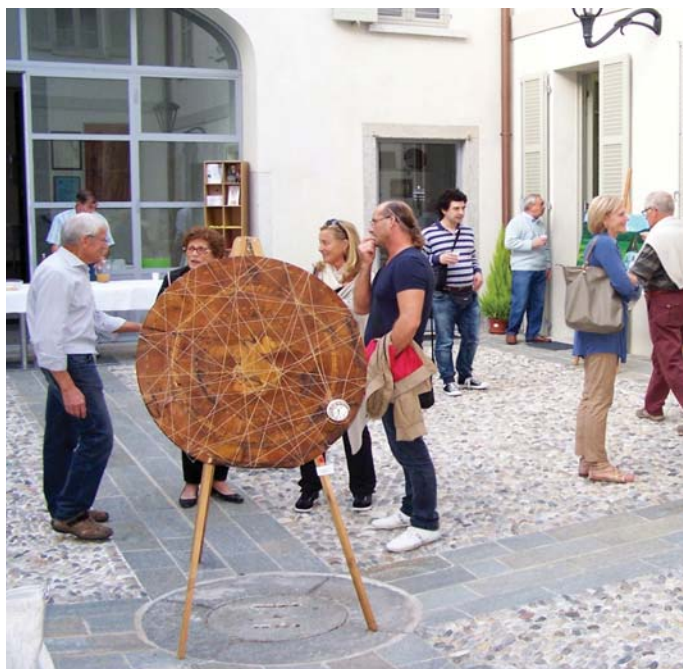
La mostra di artisti seregnesi al Circolo S. Giuseppe

stesso periodo, la sala Minoretti ospiterà tra sabato 3 e domenica 11 ottobre una mostra promossa dal Centro Psico Sociale di via Oliveti e tra sabato 17 ottobre e domenica 1 novembre una rassegna dedicata al grande ciclista seregnese Giacinto Santambrogio, voluta dalla sua famiglia, dal Circolo culturale San Giuseppe, dalla Salus ciclistica e dall'Asd Santambrogio. Tra giovedì 22 ottobre e domenica 1 novembre, invece, nella penitenzieria della Basilica San Giuseppe, è in programma una mostra fotografica sul legame tra San Giovanni Paolo II e Seregno, organizzata dalla Comunità pastorale omonima e dal Circolo culturale San Giuseppe, con scatti di Pierino Corno.