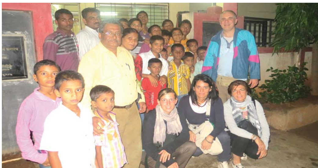
L'incontro alla casa famiglia di Chakaan

A Pune e Mumbai è avvenuto l'incontro con le ragazze del progetto Go On: la scommessa per loro è un'istruzione superiore, garanzia di una professione per il futuro.