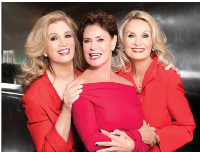
Da sin. Iva Zanicchi, Corinne Clery e Barbara Bouchet

Nella difficile società di oggi la scommessa per un futuro di civiltà e di crescita non può che passare dalla centralità della cultura e del suo operare. E il "San Rocco" ha tutte le carte in regola per essere tutto ciò da 58 anni, con il suo 44mo cartellone consecutivo della stagione di prosa. E' un teatro serio, che i suoi problemi li affronta e li risolve senza clamore, e soprattutto che basa la sua forza sul rapporto col pubblico, che fedelmente lo segue da 58 anni e sempre complice delle situazioni. Un teatro che nel corso dell'oltre mezzo secolo si è adeguato alle nuove strutture e alle nuove e costosissime norme di sicurezza imposte dalla legge. Lavori che ha iniziato nella passata stagione e che continueranno per essere completati dal maggio del prossimo anno. Lavori che stanno impegnando oltre misura e oltre ogni capacità lente