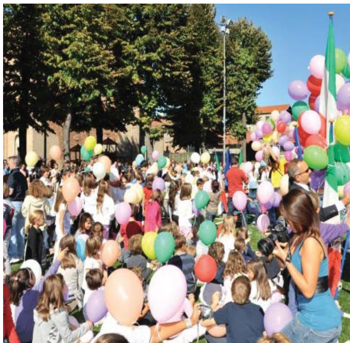
Momenti di festa in oratorio