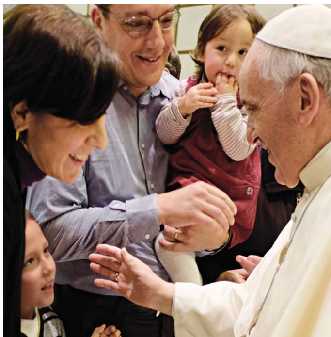
Papa Francesco con una famiglia