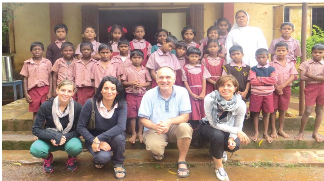
I quattro volontari di Auxilium India in una delle numerose tappe del loro viaggio

Poi è stata la volta di Kalathur e Kasargod, nel Karnataka. "Qui i bambini non ci davano tregua, con il loro entusiasmo inesauribile che disarmava e conquista. Ci correvano incontro, si contendevano un posto vicino a noi. Ci chiedevano di restare a lungo, con un affetto contagioso, potente, magico!". E qui, ai confini con la giungla indiana, sono stati valutati i nuovi progetti: l'ampliamento del convitto e letti per il dormitorio dei bambini.