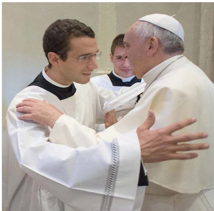
Simone Sormani con Papa Francesco

Mi porto dentro un verbo: crescere. Sento che tutte le esperienze vissute mi hanno fatto crescere: all'inizio sono stato spronato a mettermi sempre in gioco nelle attività dell'oratorio; ma col tempo ho compreso che quello era l'unico modo per tirare fuori ciò che avevo dentro. Ricordo in particolare la prima volta che ho pensato di diventare prete. Ero all'inizio della prima superiore e stavo iniziando a vivere l'oratorio con grande generosità di tempo. Un altro bellissimo momento, ogni tanto ci ripenso, è il giorno in cui il prevosto Motta diede l'annuncio che sarei entrato in seminario. Eravamo in montagna,