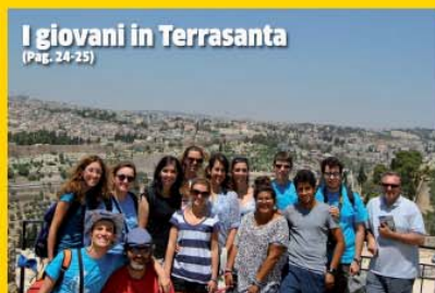
I giovani in Terrasanta (Pag. 24-25)