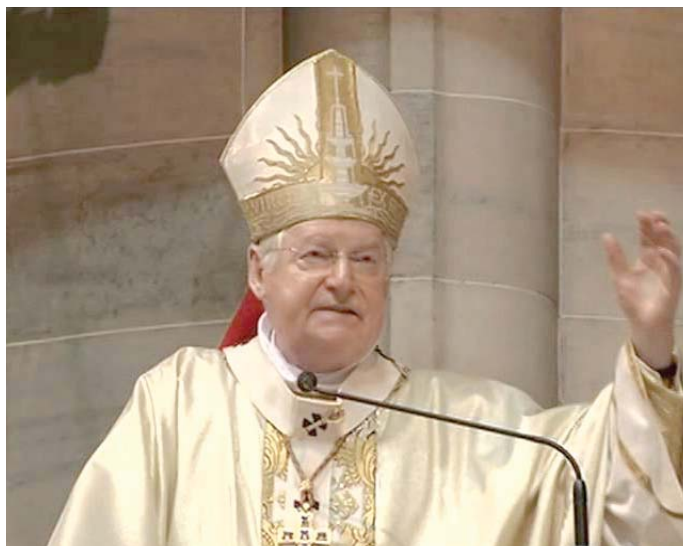
L'arcivescovo cardinale Angelo Scola

Questo stesso cammino di condivisione diventa possibile per ciascuno di noi se affrontiamo l'esistenza a partire dall'incontro con Cristo presente e vivo nella comunità cristiana. Da questo incontro nasce un nuovo modo di pensare gli affetti, il lavoro, la festa, l'educazione, il dolore, la vita e la morte, il male e la giustizia. In definitiva per l'Arcivescovo si tratta di immedesimarsi col pensare e il sentire di Gesù. E questa esperienza, lungo dall'essere privata, diventa cultura, nel senso che ogni fedele contribuisce così alla maturazione della comunità cristiana