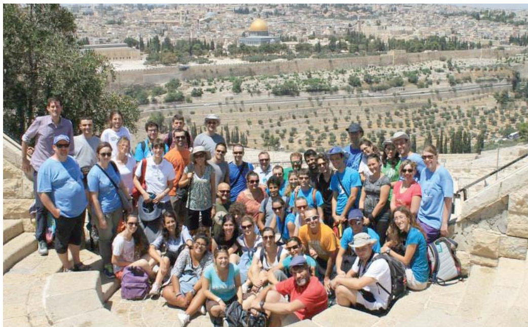
Il gruppo dei giovani pellegrini della diocesi di Milano

L'ultimo giorno, in una condivisione nella fede, ognuno ha dato voce a ciò che nel proprio cuore quel viaggio ha lasciato: una "pietra" (un luogo particolarmente significativo) e una Parola. È questo che vorremmo riconsegnarvi ringraziandovi del sostegno che ci avete dato nella preghiera e con la vostra generosità. Molti di noi hanno ritrovato nell'esperienza del deserto un luogo di essenzialità dove, aiutati dal silenzio assoluto a far tacere tutte le parole e i pensieri superflui, emerge solo ciò che veramente è importante, a partire dalla relazione con Dio. Il deserto è "un luogo estraneo dove si prova smarrimento". Ci siamo così avvicinati all'esperienza del popolo d'Israele che, dopo essere uscito dall'Egitto, si incammina nel deserto verso la Terra promessa senza certezze se non quella di avere Dio al proprio fianco. Questa vicenda è come parabola della nostra vita: anche noi viaggiamo spesso in luoghi inospitali senza punti di riferimento, dove non ci sentiamo accolti, dove non è facile riconoscere la strada da percorrere. Nella solitudine di questo cammino sono però piantati semi capa-