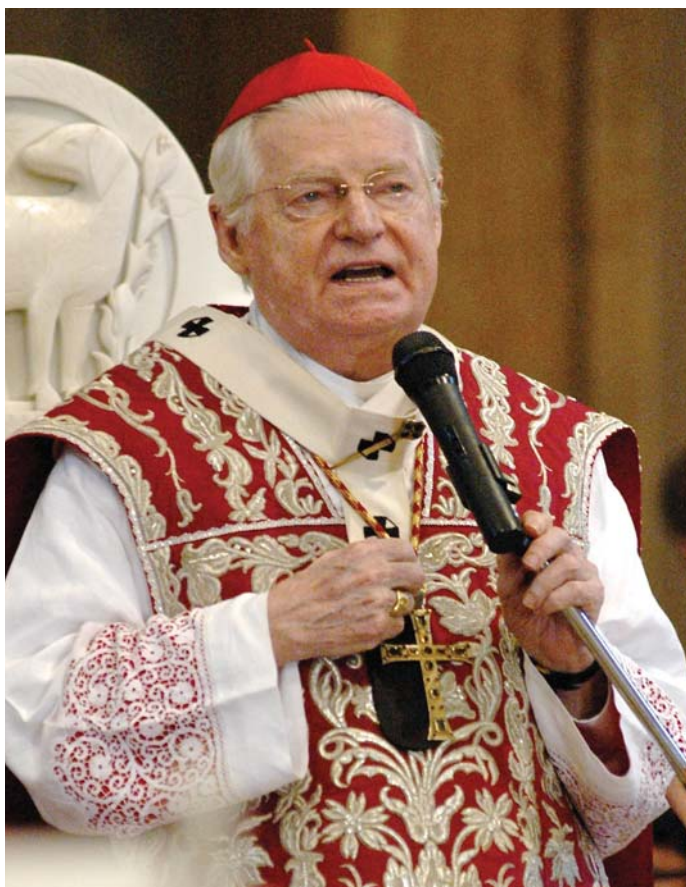
Il cardinale Scola in Basilica il 14 settembre 2014

importante che questa presenza continui. Perché le Caritas Parrocchiali sono un punto di riferimento consolidato per chi ha un bisogno e per chi ha voglia di offrire un aiuto. Però un coordinamento cittadino tra le Caritas (funzione che molto bene possono assolvere il Centro di Ascolto e la Caritas cittadina) può accrescere la qualità e la qualificazione dell'intervento caritativo. Ecco che la Comunità Pastorale amplia gli orizzonti del valore delle esperienze locali".