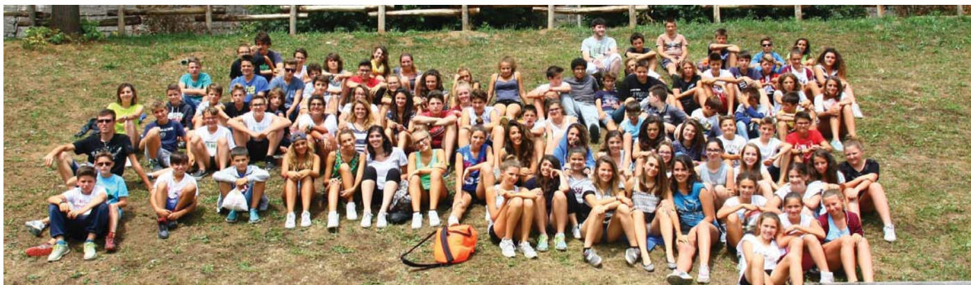
Le vacanze del secondo turno del S. Rocco