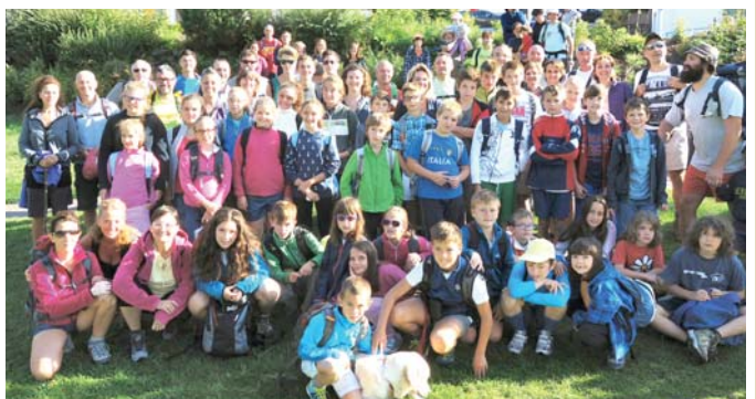
Il gruppo famiglie del San Rocco

I momenti di gioco, organizzati dai bravissimi animatori, di preghiera con il don e le "faticose" gite ti permettono di fare nuove amicizie e divertirti in compagnia. Ringrazio ancora gli animatori e il don per averci "soportato" in questa bella avventura e gli "elfi" che ci hanno preparato da mangiare."