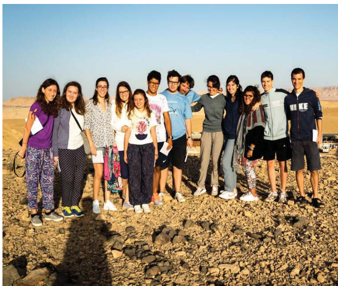
I giovani seregnesi nel deserto del Negev

ritrovare nella stessa struttura la presenza di tante confessioni cristiane – dai cattolici agli abissini, dai ortodossi agli armeni, dai copti agli etiopi – la cui convivenza non è sempre facile. Ma il mistero che qui si contempla sa unire la diversità