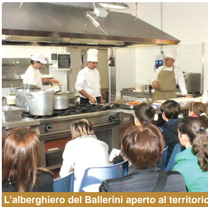
L'alberghiero del Ballerini aperto al territorio

Questo inizio settembre ha visto come novità l'avvio dell'English Summer Camp nelle prime due settimane di settembre precedenti l'inizio dell'anno scolastico ordinario. Un momento ancora di vacanza per i bambini e di lavoro per le famiglie. Madrelingua statunitensi, ospitati dalle famiglie dei ragazzi, hanno animato un mini campus rivolto ai bimbi della primaria, in cui gioco e apprendimento naturale della lingua coabitano nelle strutture all'aperto del Candia, permettendo ai più piccoli un approccio semplice e innovativo alla lingua inglese.