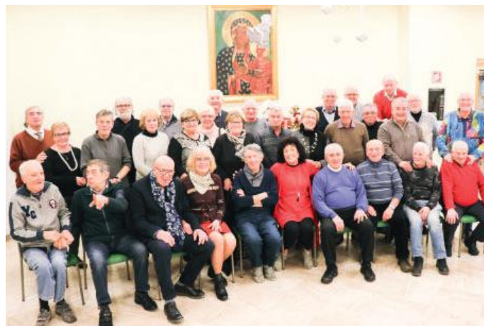
L'incontro con i coscritti della classe 1946