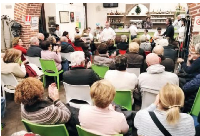
Lo spettacolo dei ragazzi de L'Aliante