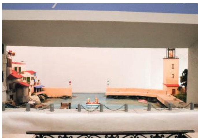
Santuario di Santa Valeria