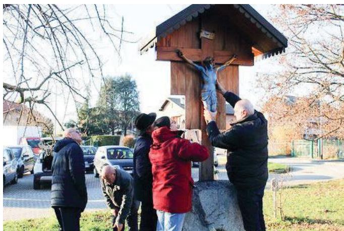
La rimozione del crocifisso