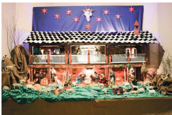
Chiesa parrocchiale San Carlo