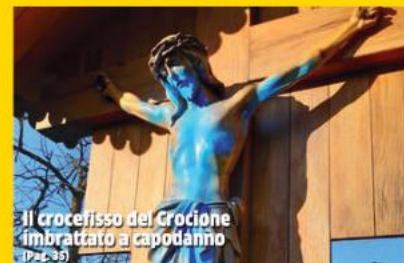
Il crocifisso del Crocione imbrattato a capodanno (Pag. 35)