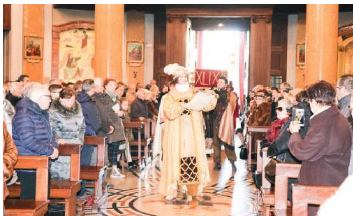
L'arrivo del corteo in Basilica