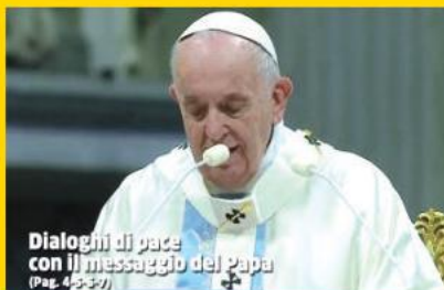
Dialoghi di pace con il messaggio del Papa (Pag. 45-52)