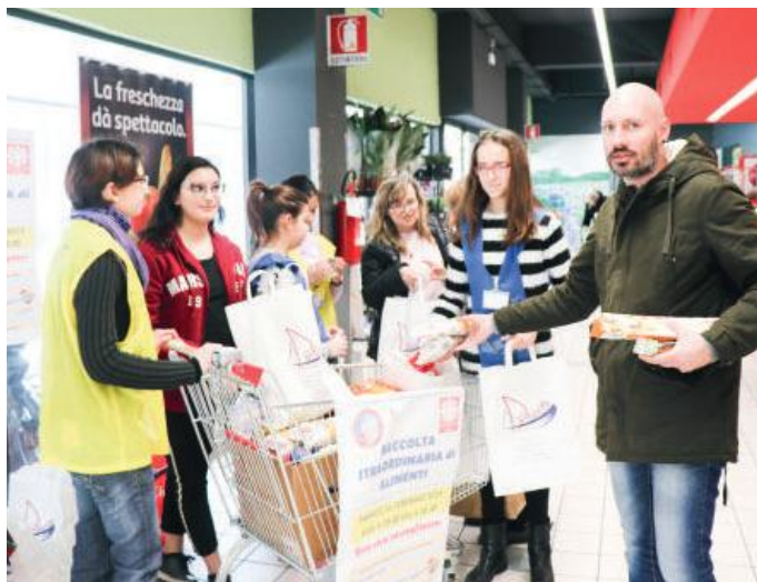
La raccolta dello scorso anno

La raccolta si svolgerà dalle 9 alle 19: i ragazzi/e con gli educatori stazioneranno davanti ai supermercati (con pettorine e tesserini di riconoscimento) per proporre agli acquirenti di donare qualche alimento acquistato durante la spesa. Al momento i supermercati presso i quali verrà effettuata la raccolta sono In's Mercato di via Valassina 40, Simply Market di corso Matteotti 15 e Md Market di via Milano. Ai genitori è stato proposto di rendersi disponibili con le proprie auto per il trasporto dei generi alimentari dai supermercati al centro di raccolta. Le adesioni dei ragazzi/e e quelle dei genitori vanno comunicate ad educatori e responsabili degli oratori entro il 4 febbraio.