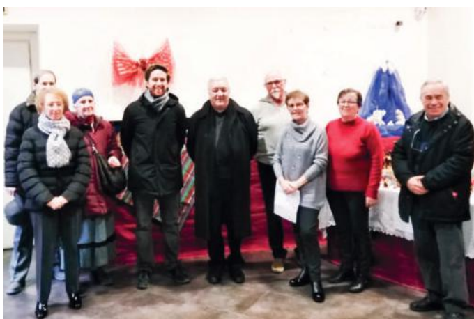
L'inaugurazione della mostra dei presepi