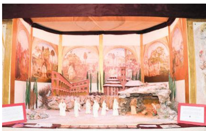
Abbazia San Benedetto