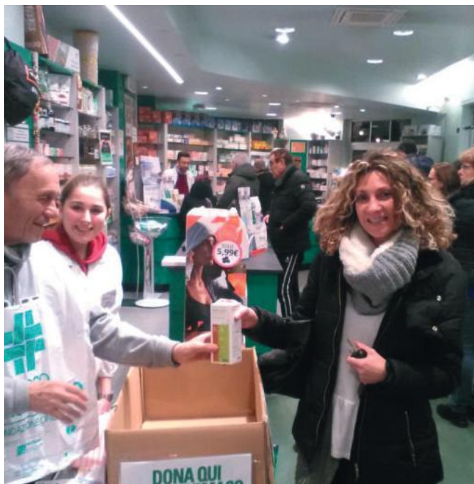
La consueta raccolta di farmaci nelle farmacie

raccolte a Seregno 1040 confezioni, su un totale di 421.904 confezioni di farmaci raccolte in tutta Italia.