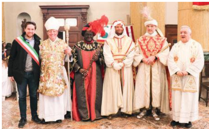
I Magi con sindaco, vicario e prevosto

Una splendida giornata di sole, ha favorito il dispiegarsi della 49ma edizione del Corteo dei Magi, organizzata come sempre dai giovani dell'oratorio San Rocco, con tanta cura, meticolosità, passione, dedizione e impegno. Per le vie del centro città hanno sfilato 190 figuranti, tra bambini, ragazzi, giovani e adulti. Diverse sono state le novità della 49ma edizione. Sono state completamente rinnovate le portantine delle varie regine, impreziositi alcuni abiti con lustrini e strass, e tanti altri piccoli particolari. Per la prima volta, oltre ai tre splendidi cavalli neri che trainano la biga e l'immacabile gregge di pecore, c'erano anche due lama. Un corteo che ha già guardato alla tappa del cinquantesimo, a cui i giovani organizzatori puntano fin d'ora a raggiungere