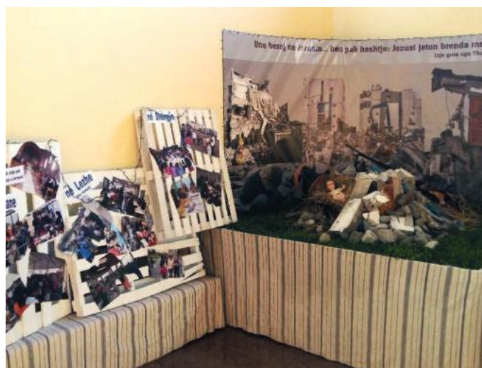
Il presepe di Blinisht con macerie del terremoto

Ci stiamo operando per cercare di essere "un balsamo per le ferite di molti". Abbiamo incontrato tutte le famiglie ospitate nelle strutture alberghiere di Sh Gjini: in tutto circa 1300 persone. Qualche indumento donato, qualche