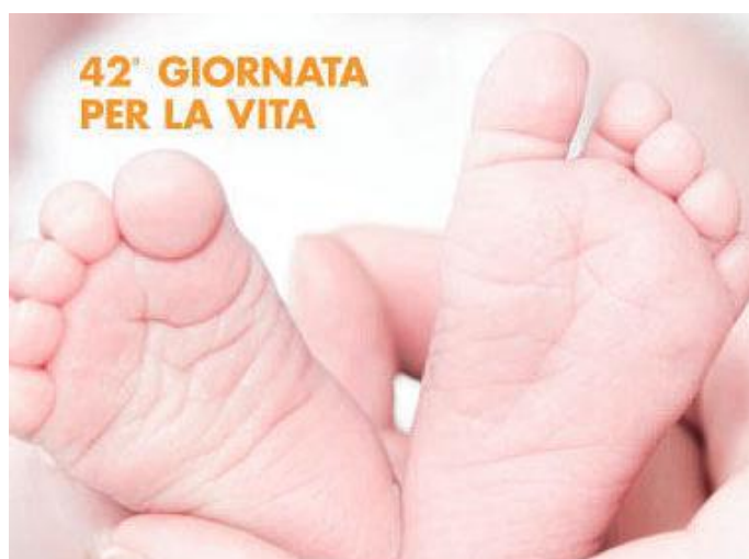
L'immagine della Giornata per la vita 2020

2. È solo vivendo in prima persona questa esperienza che la logica della nostra esistenza può cambiare e spalancare le porte a ogni vita che nasce. Per questo papa Francesco ci dice: “L'appartenenza originaria alla carne precede e rende possibile ogni ulteriore consapevolezza e riflessione”(1). All'inizio c'è lo stupore. Tutto nasce dalla meraviglia e poi pian piano ci si rende conto che non siamo l'origine di noi stessi. “Possiamo solo diventare consapevoli di essere in vita una volta che già l'abbiamo ricevuta, prima di ogni nostra intenzione e decisione. Vivere significa neces-