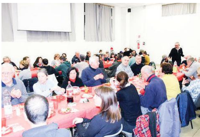
I numerosi partecipanti alla cena di condivisione