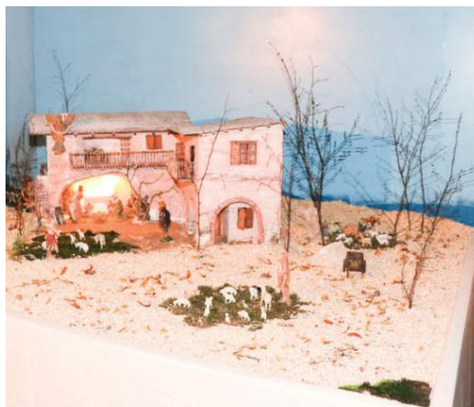
Chiesa B.V. Addolorata al Lazzaretto