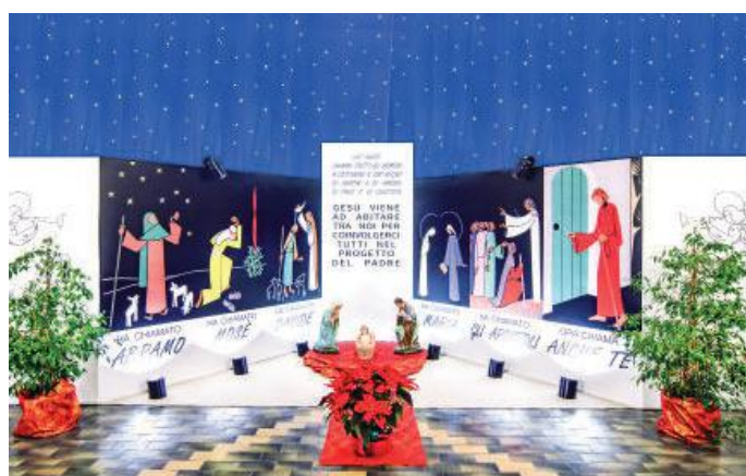
Istituto Suore Canossiane