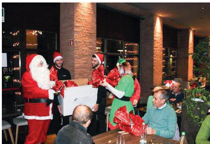
I volontari della Cri distribuiscono i piccoli doni