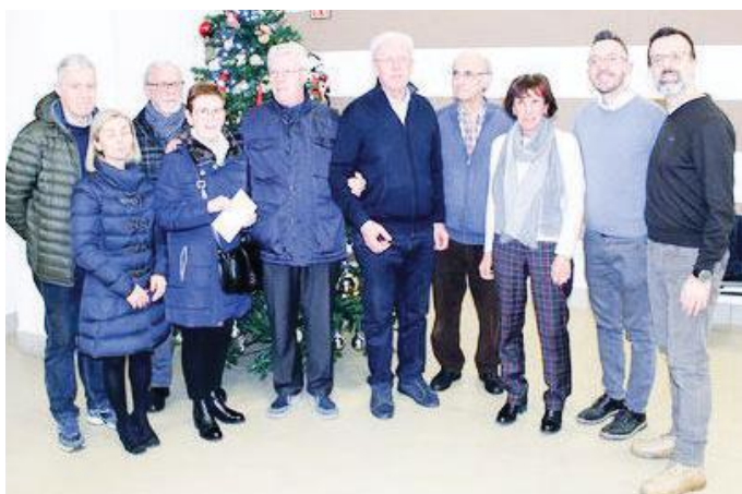
La consegna del contributo del Circolo S. Giuseppe