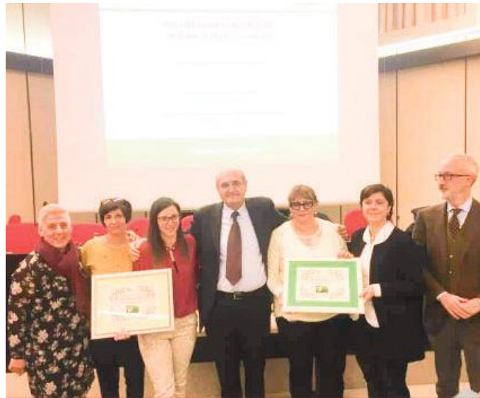
Lo staff del Don Orione premiata dall'Ats

E' stata una grande occasione di crescita che ha permesso di focalizzarsi sul lavoro quotidiano, di pensare al modo in cui viene svolto e a quali stra-