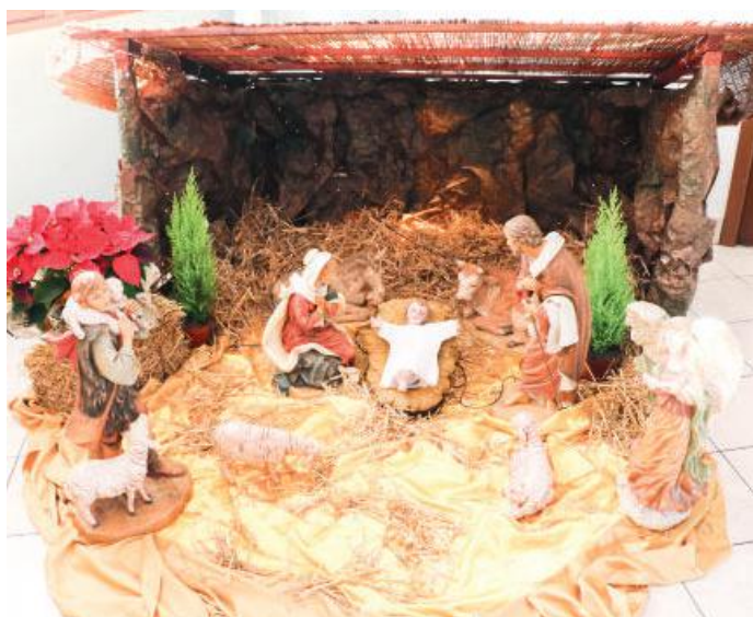
Istituto Pozzi - Figlie della Carità