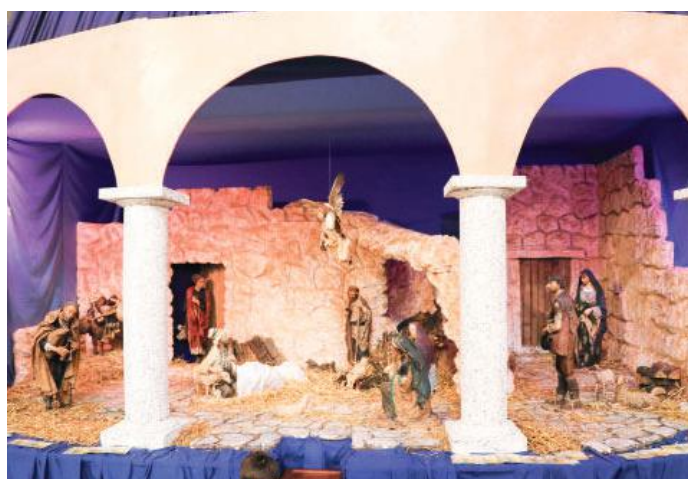
Basilica San Giuseppe

Non solo tradizione ma anche attenzione al mondo nei presepi di chiese, santuari, istituti e monasteri