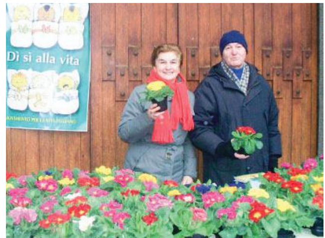
Il tradizionale banchetto con le primule

■ Sabato 1 e domenica 2 febbraio “Un fiore per la vita” ai banchetti davanti a tutte le chiese cittadine