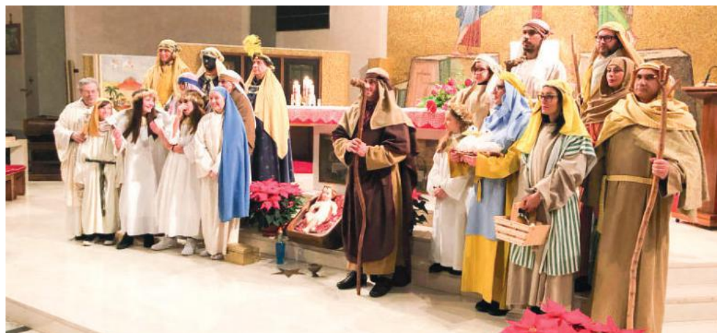
Il gruppo dei figuranti che ha dato vita al presepe vivente

"Frequento il gruppo sportivo del Lazzaretto - racconta -, perché due delle mie bambine vi partecipano come atle-