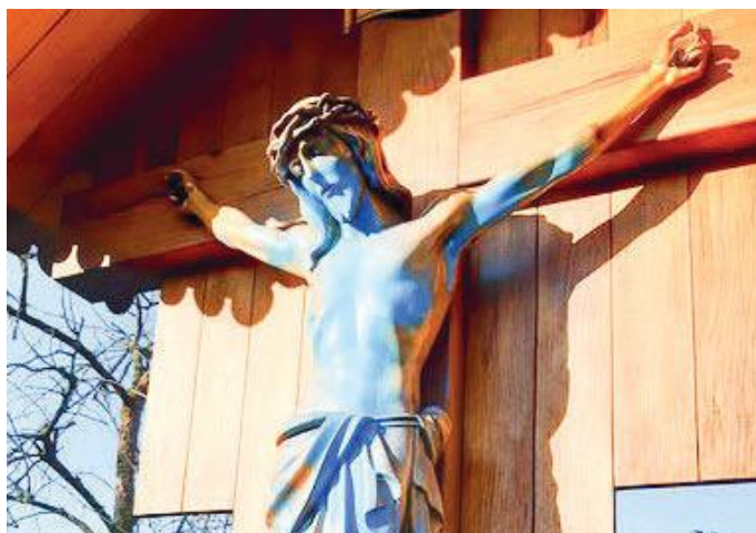
Il crocifisso imbrattato la notte di Capodanno

Il manufatto ligneo, che risale al 1931 e che nel tempo è stato più volte riqualificato, è stato poi rimosso nel pomeriggio dai confratelli della parrocchia Sant'Ambrogio, storicamente legati al crocifisso così come tanti abitanti del quartiere, guidati dal presidente diocesa-