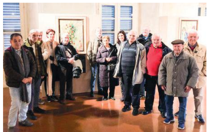
Il gruppo in visita alla mostra di Salvador Dalí

Con questi presupposti la visita avrebbe potuto essere di difficile comprensione, ma gli ospiti hanno aperto le loro menti e hanno sperimentato come il sogno possa esse-