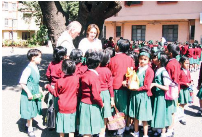
La prima visita alla missione di Lonavla nel 2005

Nel suo cammino Auxilium India ha intercettato poi altri bisogni a cui, grazie alla generosità di molti, si è dato risposta: la costruzione dell’ospedale rurale di Malawli intitolato a suor Camilla, oggi diventato un presidio sanitario di riferimento, l’ampliamento delle scuole delle missioni di Benaulim e Kalathur, gli arredi scolastici per i centri di Nandgad e Mondhwa.