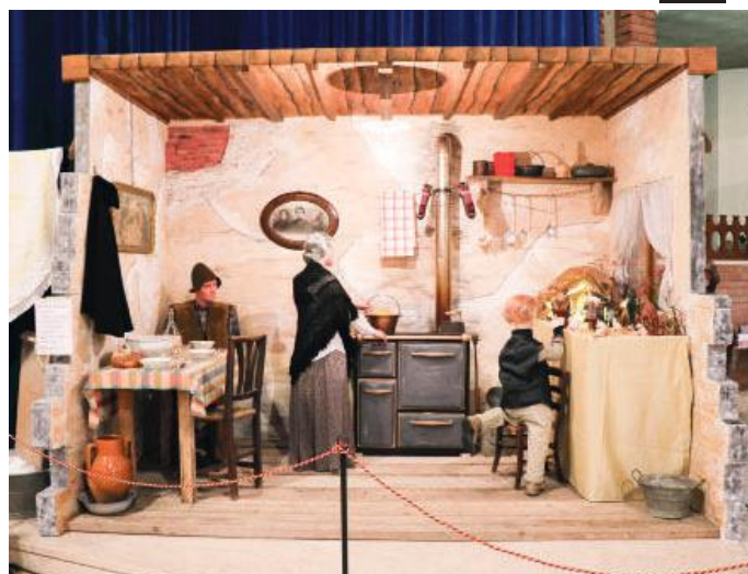
Chiesa parrocchiale S. Ambrogio