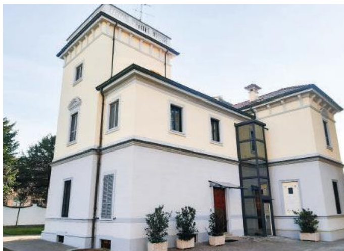
La villa Colli, primo nucleo dell'attuale Opera

Giovanni ha certamente avuto modo di visitare, magari per semplice curiosità, il Piccolo Cottolengo aperto da don Orione a Genova. Le tante parole udite, qui trovano la più splendida conferma. Quell'uomo che forse non conosce di persona trova posto nel suo