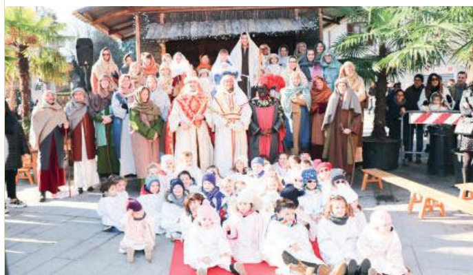
Il corteo alla Natività a S. Valeria