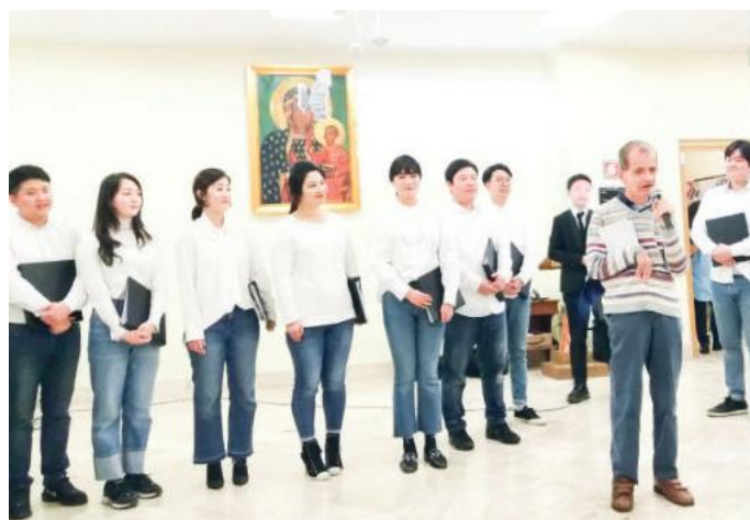
Il coro coreano "Milano Grace Church"