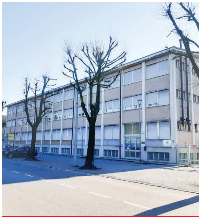
Il complesso parrocchiale di via Wagner

In questo senso, ben vengano le attività di associazioni, movimenti, gruppi di ispirazione cristiana. Ma anche di