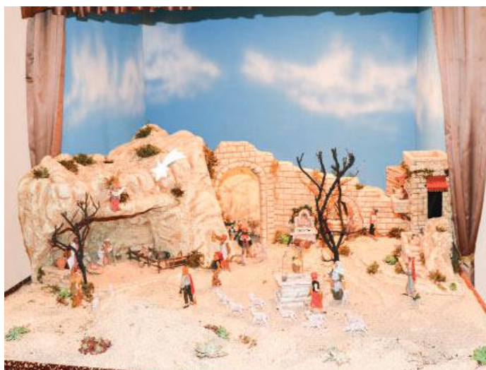
Chiesa parrocchiale S. Giovanni Bosco al Ceredo