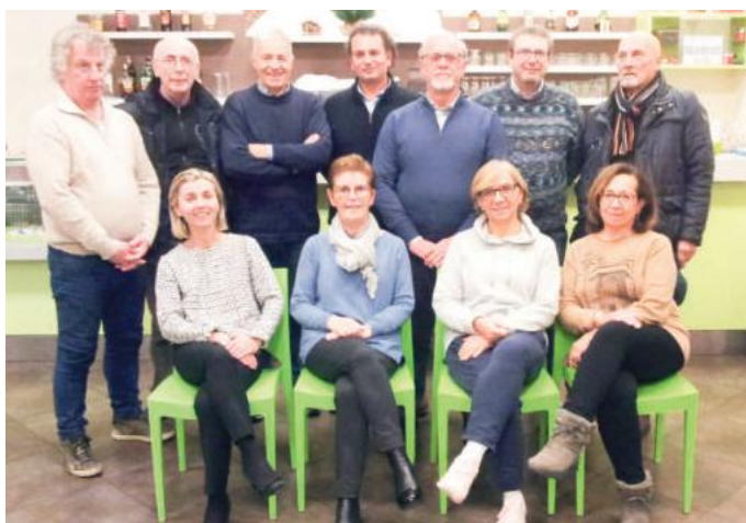
Il nuovo consiglio direttivo al completo