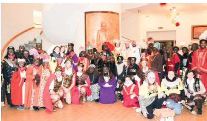
Il corteo al Don Orione