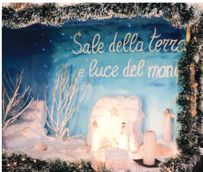
Chiesa di San Salvatore