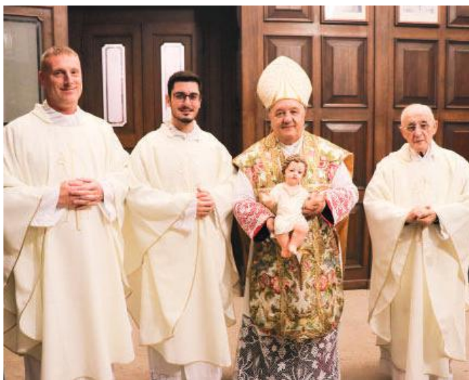
I celebranti della messa di mezzanotte

Nella sua omelia mons. Molinari si è soffermato sulla parola "sguardo": "La liturgia - ha detto - è un invito ad abbandonare lo sguardo pre-occupato e cupo su noi stessi, sugli altri, sul mondo vicino e lontano. Ci sono certamente motivi di lamento e di sfiducia... si fa fatica a rintracciare la speranza di cui tutti abbiamo un immenso bisogno. Ma il vangelo di Natale che abbiamo ascoltato - ha sottolineato - ci fa pensare ad uno sguardo che esprime benevolenza e armonia. Lo sguardo del bimbo di Betlemme è quello di Dio che custodisce e salva con occhi di tenerezza e induce anche noi ad uno sguardo di benedizione per l'anno passato e su quello che inizia. Uno sguardo buono genera bontà, uno sguardo tenero genera tenerezza, uno sguardo benediciente genera benedizione. E' lo sguardo benediciente di Dio su di noi a indurci a uno sguardo buono su noi stessi e sulla nostra comunità, sulla nostra città e sulla nostra terra che amiamo, sull'anno che iniziamo. Con questo sguardo be-