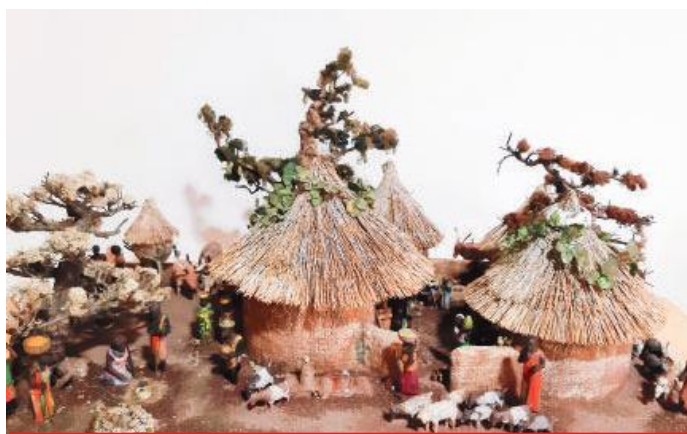
Il presepe del Gsa alla mostra del museo Vignoli

È stato un mese di dicembre molto impegnativo quello dei volontari del Gruppo Solidarietà Africa che si sono dedicati alla preparazione dei presepi, tradizionale momento di sensibilizzazione sui temi e sui progetti proposti dal sodalizio in Africa occidentale.