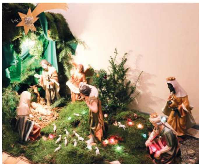
Adoratrici perpetue SS. Sacramento