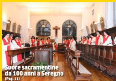
Suore sacramentine da 100 anni a Seregno (Pag. 11)