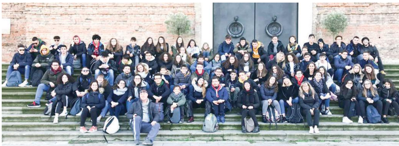
Il folto gruppo dei partecipanti al pellegrinaggio a Padova e Venezia di fine anno