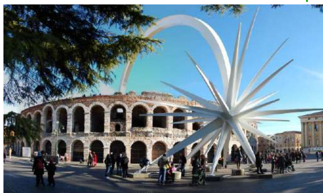
Arena di Verona