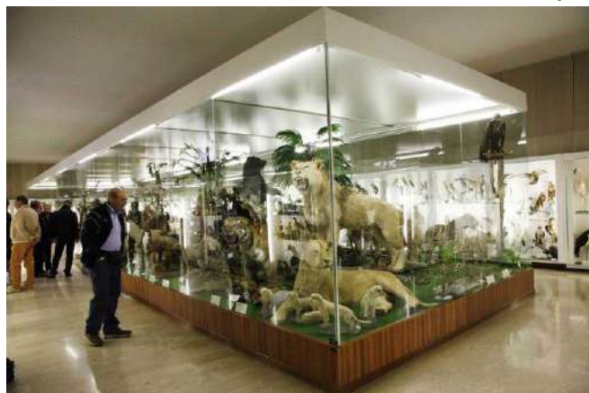
Museo di Chiampo