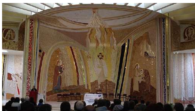
Santuario di Chiampo

Iscrizioni in sacrestia della Basilica e/o nelle segreterie parrocchiali entro domenica 11 marzo (o fino ad esaurimento dei posti disponibili).